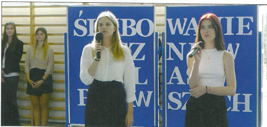
Część artystyczną zaprezentowali uczniowie starszych klas

i reformator praw w Polsce przedrozbiorowej, uczestnik insurekcji kościuszkowskiej i wojen napoleońskich – był przecież Wybicki także poetą, autorem wspomnień, wielu pism politycznych i utworów literackich, a prywatnie – ojcem dwóch synów, dbającym o ich wykształcenie i patriotyczne wychowanie. Dla milionów Polaków pozostaje jednak przede wszystkim twórcą Mazurka Dąbrowskiego – pieśni, która przyniosła nadzieję na odzyskanie niepodległości, a ostatecznie stała się hymnem narodowym wolnej już Polski.