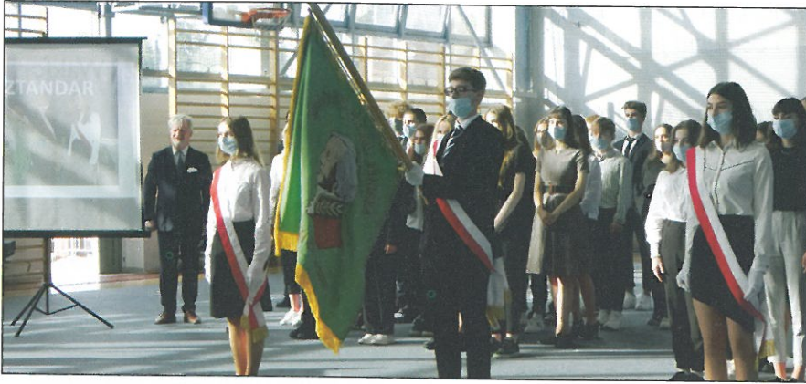
Wzruszająca ceremonia pożegnania starego sztandaru, który szkole towarzyszył od 1977 roku