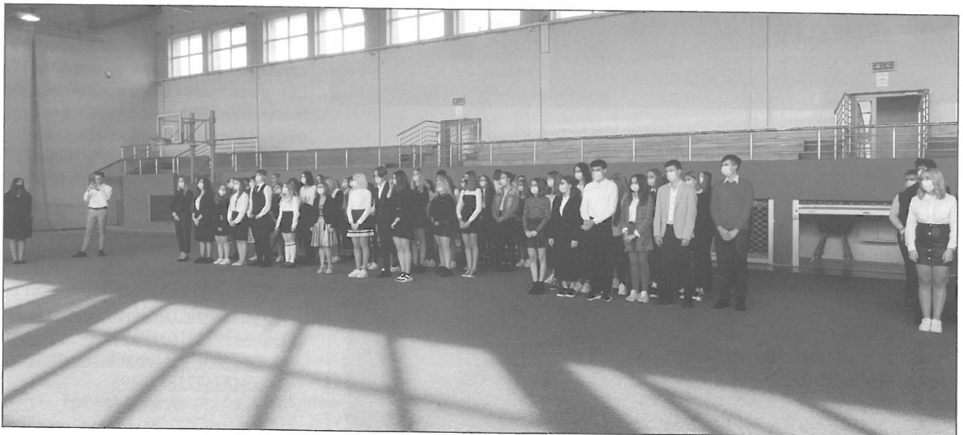
Dla społeczności VII Liceum Ogólnokształcącego im. Józefa Wybickiego 29 września 2020 roku był dniem wyjątkowym