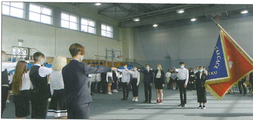
Przyrzeczenie uczniów klas pierwszych